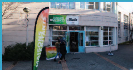
MAISON DES HABITANTS