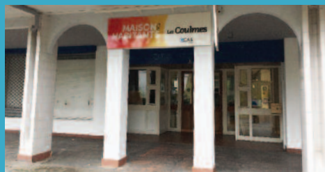
MAISON DES HABITANTS